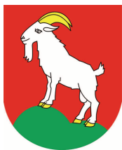
Obec Velké Karlovice